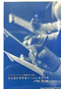
コンプライアンスインストラクタ ハンドブック(入門編) 無料進呈

第2部では、内部通報制度運営と並ぶコンプライアンス部門の重要職務であるコンプライアンス教育の講師業務について学んでいただきます。コンプライアンス経営では啓発活動が重要であり、全社員を対象とした継続的な教育が欠かせません。コンプライアンス部門のスタッフには研修講師業務に習熟することが求められます。本講座では社内講師を務めるための心構えから、コンプライアンス研修の企画、教材作成、講義のコツ、及び受講者の参画を促す双方向型の研修の進め方まで、コンプライアンス研修の講師として求められる一通りの知識が習得できます。